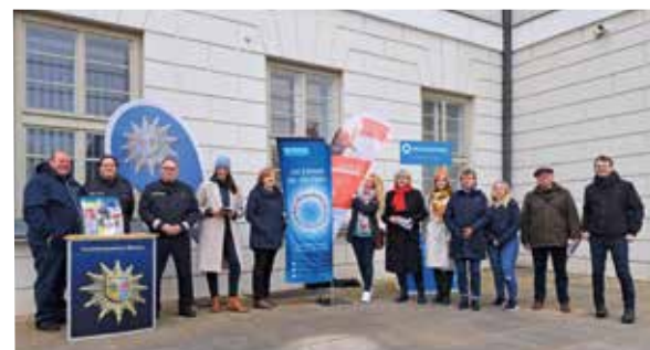
Alle beteiligten Akteurinnen und Akteure in der Hansestadt Wismar am 22.03.2024.