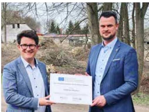
Landrat Tino Schomann (re.) übergab den Zuwendungsbetrag an Boltenhagens Bürgermeister Raphael Wardecki.

Die Entwässerung des Weges erfolgt über vorhandene Mulden und Gräben. Im Zuge der Bauarbeiten wird das vorhandene Grabensystem beräumt und neu profiliert.