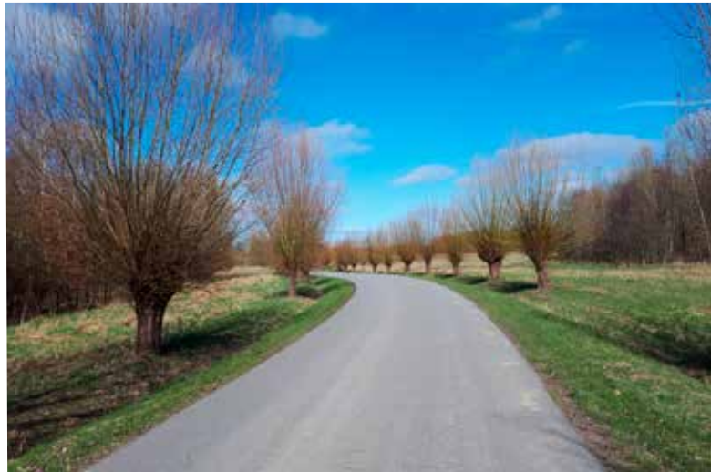
Bernd Klose • Frühlingserwachen

Mit dem Einsenden von Fotos bestätigen Sie, dass Sie der Urheber des eingesandten Materials sind, keine Persönlichkeitsrechte Dritter verletzt werden und stimmen ausdrücklich einer unentgeltlichen Nutzung für alle Verwendungszwecke durch den Landkreis Nordwestmecklenburg zu.