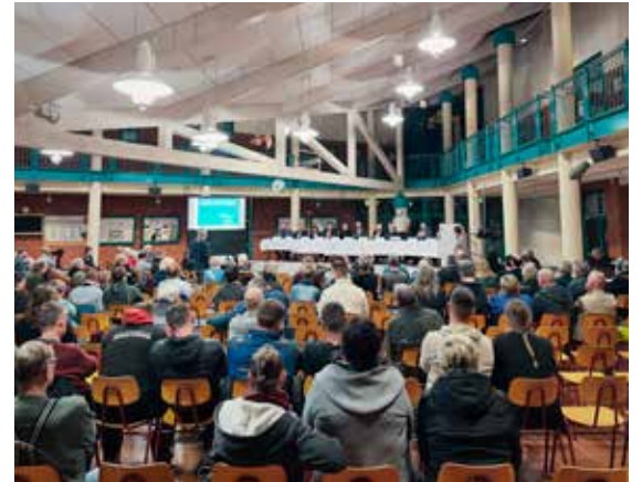
Auf der Informationsveranstaltung am 14. März in Gadebusch konnte der Landkreis die Bürgerinnen und Bürger im direkten Austausch informieren. Landkreis Nordwestmecklenburg

einen Betreiber betreut. Dieser entwickelt auch ein Angebot für Beschäftigung und Integration. Der Landkreis Nordwestmecklenburg steht jederzeit für alle Fragen und Anliegen – sowohl der Asylsuchenden, als auch den Bürgerinnen und Bürgern – zur Verfügung.