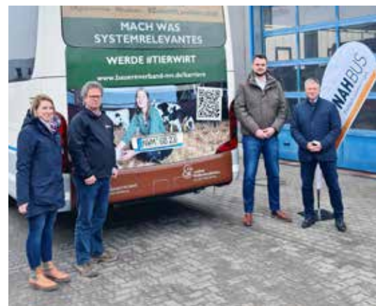
Drei Busse von NAHBUS mit der „Landwirtschafts“-Werbung fahren jetzt durch Nordwestmecklenburg.

Für Fragen rund um eine Ausbildung in den „Grünen Berufen“ steht der Kreisbauernverband Nordwestmecklenburg auf den Jobmessen „vocatium“ in Schwerin am 16. und 17.04.2024 in