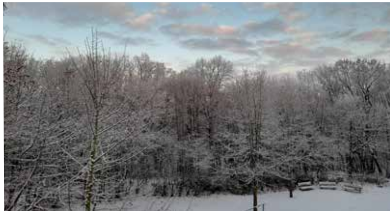
Dirk Kaphengst • Winter über Nacht vor dem Balkon im Kopernitzta

Mit dem Einsenden von Fotos bestätigen Sie, dass Sie der Urheber des eingesandten Materials sind, keine Persönlichkeitsrechte Dritter verletzt werden und stimmen ausdrücklich einer unentgeltlichen Nutzung für alle Verwendungszwecke durch den Landkreis Nordwestmecklenburg zu.