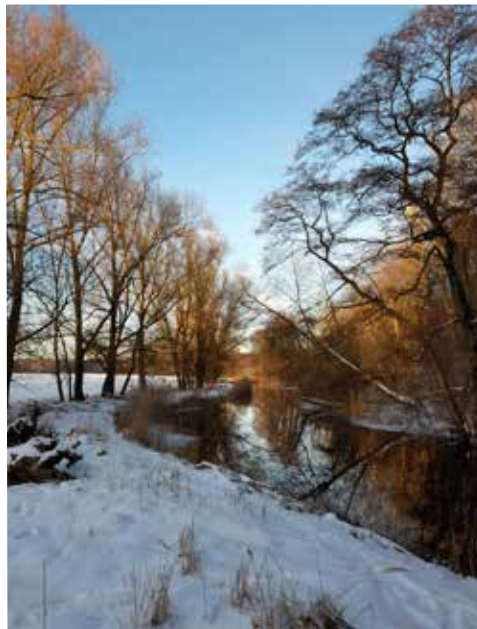
Dirk Kaphengst • Der Tönnisbach bei Warin im Winter, an der Grenze zum Landkreis Ludwigslust-Parchim