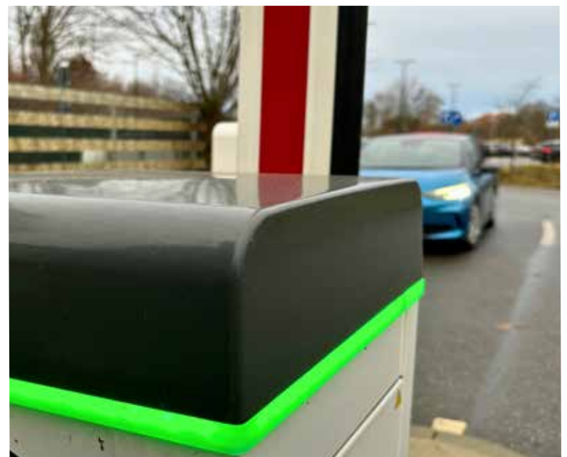
Mit der Inbetriebnahme der Schrankenanlage der Parkplatzanlage Rostocker Straße verbessert sich das Parkplatzangebot am Kreisverwaltungsstandort Wismar.

Die vom Kreistag Nordwestmecklenburg beschlossene Benutzungs- und Entgeltordnung für die Parkplatzanlage Rostocker Straße ist im Internet unter www.nordwestmecklenburg.de einsehbar.