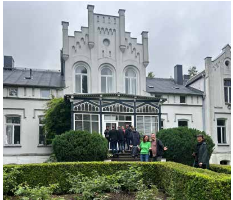
Mehr als 400 Projekte wurden bereits mit Leader-Fördermitteln unterstützt.

Skater-Anlage für Jugendliche in Groß Molzahn über die Neugestaltung der Dorfmitte in Pokrent bis zur Traditionsscheune in Kalkhorst oder aber der Kultur-Kapelle Weitendorf.