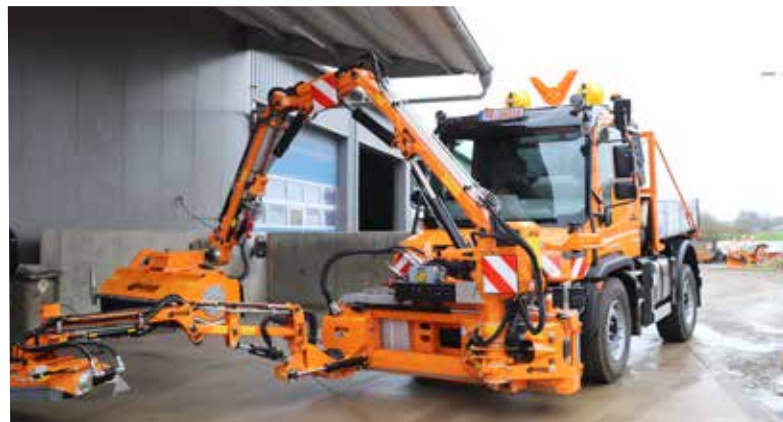
Der neue Unimog ersetzt ein Dienstfahrzeug aus dem Jahr 2014.