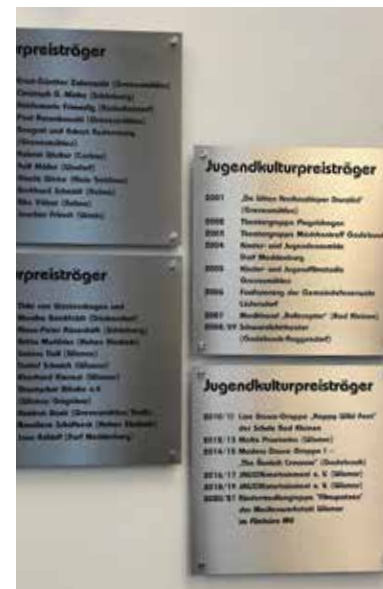
In der Malzfabrik in Grevesmühlen sind die Geehrten auf Tafeln im Foyer verewigt. Landkreis Nordwestmecklenburg

Landkreis Nordwestmecklenburg Fachdienst Bildung und Kultur Postfach 1565, 23958 Wismar