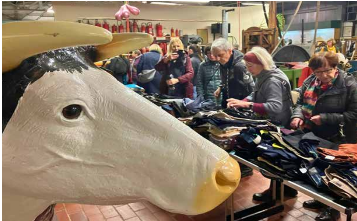
Männer verboten, Frauen willkommen: Der beliebte Frauenflohmarkt geht am 24. Januar über die Bühne.