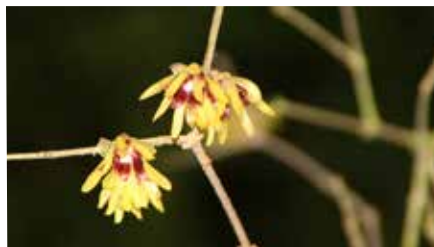
Karin Schröder • Chinesische Winterblüte