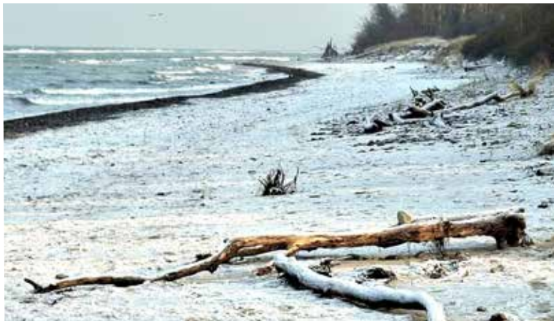
Diana Ritt • Winterruhe am Strand in Groß Schwansee