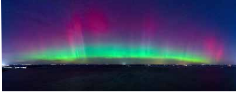
Mathias Wiesner • Polarlichter am Strand von Zierow

Einsendungen per E-Mail an: presse@nordwestmecklenburg.de Bitte dabei angeben: einmal den Bildtitel/Vorschlag für eine Bildunterschrift sowie Name und Kontaktdaten der Fotografin oder des Fotografen. Mit dem Einsenden von Fotos bestätigen Sie, dass Sie der Urheber des eingesandten Materials sind, keine Persönlichkeitsrechte Dritter verletzt werden und stimmen ausdrücklich einer unentgeltlichen Nutzung für alle Verwendungszwecke durch den Landkreis Nordwestmecklenburg zu.