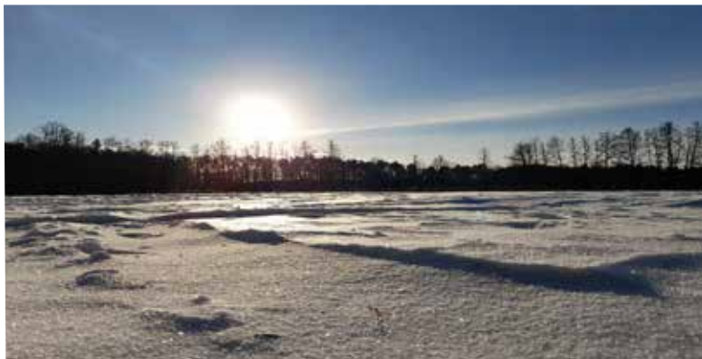
Dirk Kaphengst • Januar mit Eis und Schnee in Nordwestmecklenburg