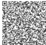
QR-Code zur Befragung