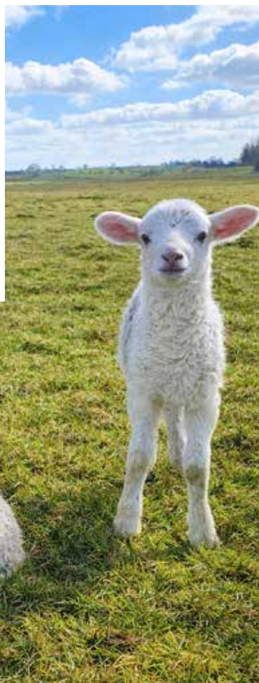
Lea Graber • Zwei Lämmer auf der Weide im sanften Licht des Frühlings