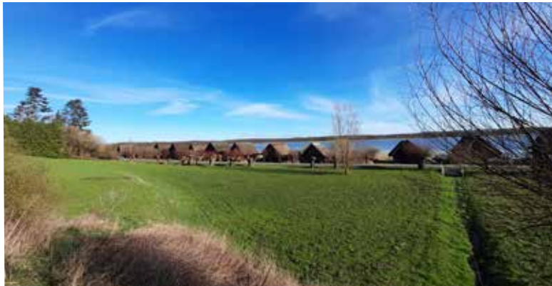
Dirk Kaphengst • Bootshäuser in Hohen Viecheln am Schweriner See in der Frühlingssonne

Einsendungen per E-Mail an: presse@nordwestmecklenburg.de Bitte dabei angeben: einmal den Bildtitel/Vorschlag für eine Bildunterschrift sowie Name und Kontaktdaten der Fotografin oder des Fotografen. Mit dem Einsenden von Fotos bestätigen Sie, dass Sie der Urheber des eingesandten Materials sind, keine Persönlichkeitsrechte Dritter verletzt werden und stimmen ausdrücklich einer unentgeltlichen Nutzung für alle Verwendungszwecke durch den Landkreis Nordwestmecklenburg zu.