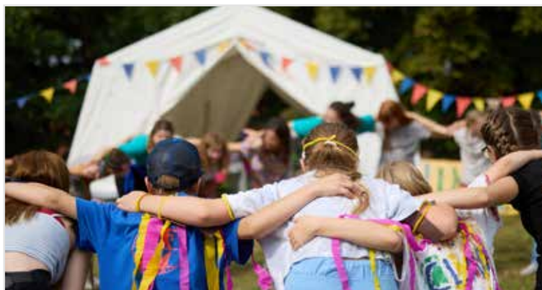
Das „Gadebuscher Musikcamp“ ist ein Ferienangebot für Kinder im ländlichen Raum.

ger Musiksommer und Landkreis Nordwestmecklenburg.