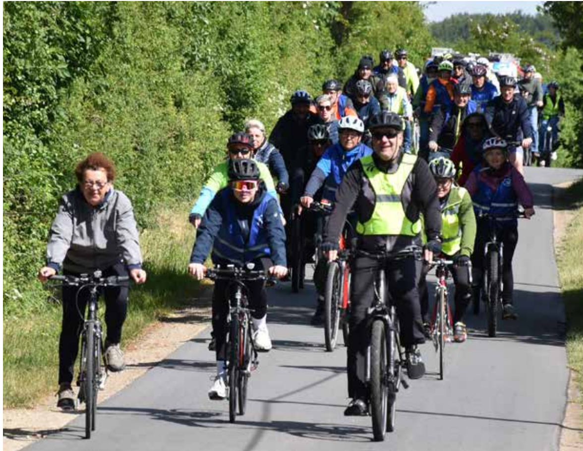
769 aktive Radlerinnen und Radler in insgesamt 48 Teams nahmen 2025 am STADTRADELN in Nordwestmecklenburg teil.