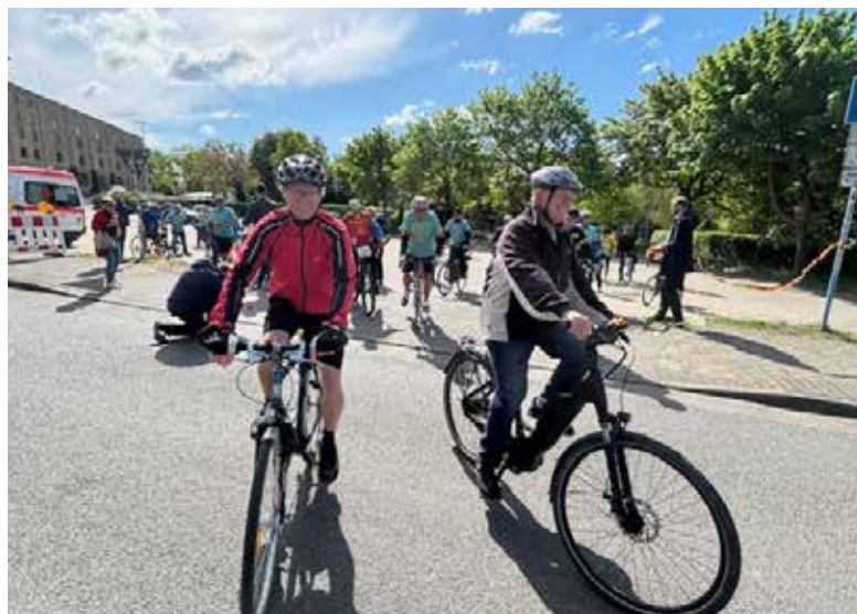
Start der Gedenktour im vergangenen Jahr.

Die traditionsreiche CAP-ARCONA-Gedenktour verbindet in diesem Jahr zum 18. Mal die beiden KZ-Gedenkort Grevesmühlen und Groß Schwansee. Am 3. Mai 1945 starben bei der Versenkung der KZ-Schiffe „CAP ARCONA“ und „THIELBEK“ in der Lübecker Bucht etwa 7.000 Häftlinge aus allen Teilen Europas. 400 Opfer wurden nach Kriegsende zunächst in Groß Schwansee direkt am Strand begraben und wenige Jahre später nach Grevesmühlen umgebettet. Das frühere Massengrab am Gedenkort in Groß Schwansee gilt heute als Symbol für diejenigen 3.000 Opfer, die nach dem Untergang der Schiffe kein Grab gefunden haben. Ihr Grab ist die Ostsee geblieben. Seit nunmehr 20 Jahren (mit 2 Jahren Pause während der Pandemie) verbindet die CAP-ARCONA-Gedenktour diese beiden Gedenkort mit einer Jedermann-Fahrradtour. Der Start erfolgt traditionell mit einer kurzen Gedenkveranstaltung um 10 Uhr an der CAP-ARCONA-Gedenkstätte in Grevesmühlen auf dem Tannenbergr. Nach einer Ehrenrunde durch Grevesmühlen erfolgt der scharfe Start um 10.45 Uhr an der Malzfabrik in Grevesmühlen. Die knapp 27 Kilometer lange Tour führt anschließend über Gostorf, Roggendorf, Rankendorf und Kalkhorst nach Groß Schwansee. Die Strecke ist für ungeübte Fahrradfahrer leicht in etwa anderthalb Stunden zu bewältigen. Am Gedenkort in Groß Schwansee werden die Teilnehmenden gebeten, sich in das Gedenkbuch einzutragen. Am Schloßgut in Groß Schwansee