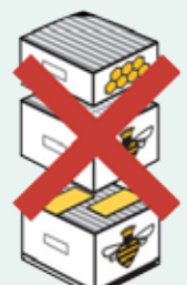
Zander, Langstroh 2-räumig