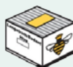
1-räumig Zander, DNM